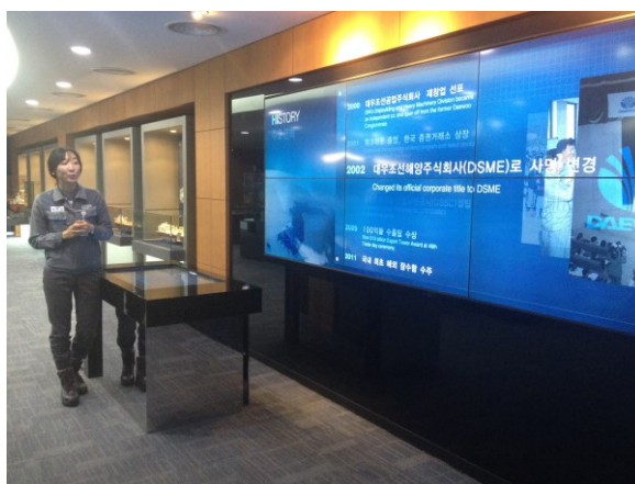
Koreanerne havde vild teknologi. Vi fik f.eks. et tandbørste-sterilisationsapparat med hjem.