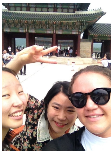
Ude og se det gamle kongepalads.