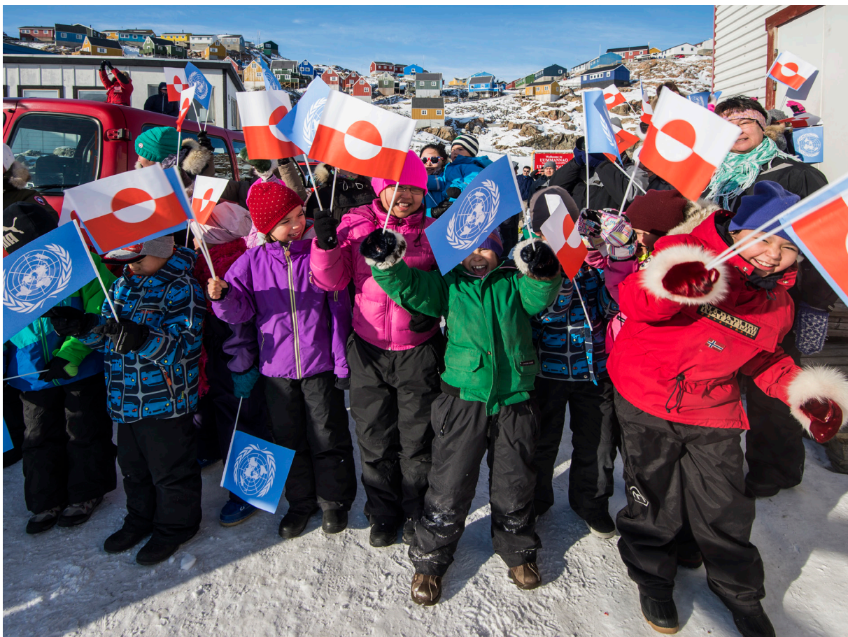
Meeqqat Uummannami UN Secretary-General Ban Ki-Moon pulaarmat 2014-imi

Taamaallaat naalagaaffittut inissisimasut FN-imut ilaasortangorsinnaapput, naalagaaffillu taakkua "innuttaasoqartuunissaat" piumasaqaatigineqartut ilagaat. Tamatumali assigiinnanngilaa immikkoortumik innuttaassuseqartutut aqqjissuussaaneqarneq. Tuluit naalagaaffiisa ilaat (Australia, Canada, New Zealand and Sydafrika) tamakkiisumik namminersulinnginnerminni Naalagaaffiit Peqatigiissortaannut (Folkeforbundet) FN-imulluunniit ilanngupput, nunaminni innuttaasut suli Tuluit Nunaanni innuttaasuusut. Aamma Pakistani FN-imut ilaasortangorpoq Tuluit Nunaat, Australia, India aamma Sydafrika ataatsimoorussamik innuttaassuseqatigitiillugit. Irlandimi Avannarlermi innuttaasut (naalackersuinikkut Tuluit Nunaannut atasuusut) marluinnik innuttaassuseqalerput 1922-mi Irlandi namminerisamik naalagaaffinngormat, taakkualu marluinnik innuttaassuseqarsinnaatitaanerat 1998-mi Belfastimik isumaqatigiissummi aalajangersarneqarpoq. Tamatumanga erserpoq naalagaaffinngortitsinissaq/ FN-imut ilaasortaalernissaq siunertaralugu inuiaqatigiinnut nassuiaat innuttaassutsimut piumasaqaataasunit immikkoortinneqarsinnaasoq.